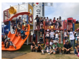
近隣の小学生向けの学童保育が3年目を迎え、今春からは卒業生を対象とした高校部も開設しました。小学生から高校生まで、成長過程に応じた適切なサポートを心がけています。

資本力があるわけでも、強力なバックアップ企業があるわけでもありませんが、小さな企業だからこそ、私達だからこそ出来ることがあると信じ、運営にあたっています。子どもたちの顔を窺って接するのではなく、深い愛情を抱くからこそ時には厳しく、小さな成長を見逃さずしっかりと褒め、子供たちの成長を促せるように心がけています。子どもたちの生活のコミュニティの中心はあくまで家族と学校ですが、私達はその2つの役割も担いつつ、かゆい所に手が届くサポートを目指し、今後も尽力して参ります。