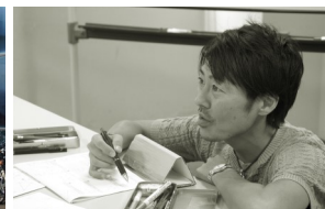
授業形式は秋田県内で最も早く一斉授業と個別指導の併用スタイルを採用しています。一斉授業と個別指導のメリットを最大限活用し、塾生の成績アップに努めています。