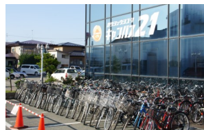
泉南のABCマートさん隣の建物です。夏場にはたくさん並んでいる自転車が目印になります。